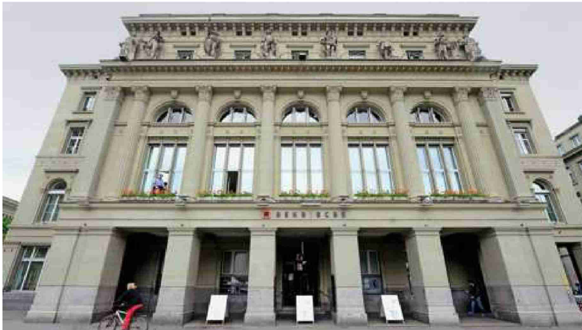
Die Berner Kantonalbank betreibt einen Handel mit nicht kotierten Aktien.

BERNER WERTE Die ausserbörslich gehandelten Aktien schnitten heuer besser ab als die börsenkotierten. Besonders gesucht sind Aktien solcher Unternehmen, die über unterbewertete Immobilien verfügen.