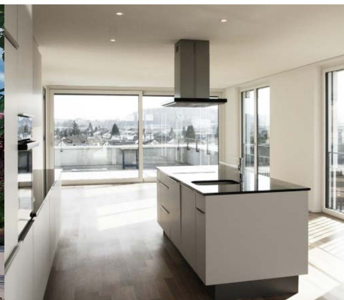
In Sachen Materialisierung sind die Wohnungen auf Eigentumswohnungsniveau, die digitalisierte Haustechnik spricht insbesondere auch ein junges, urbanes Zielpublikum an

Mitten im Grünen und doch zentrumsnah – so lässt sich der äusserst attraktive Standort des neuen Wohnquartiers «volaare» in wenigen Worten zusammenfassen. Die Aare ist, wie das Sportzentrum Zuchwil, direkt vor der Wohnungstür und die Altstadt von Solothurn ist in rund 25 Minuten zu Fuss der Aare entlang zu erreichen. Auch verkehrstechnisch ist das Quartier optimal angebunden: Eine Bushaltestelle liegt auf dem angrenzenden Grundstück, der Autobahnanschluss ist nur wenige Minuten entfernt. Die modernen, hellen Wohnungen sowie die Attikawohnungen verfügen über jeglichen Komfort. Alle haben eine grosszügige Loggia und die Attika-