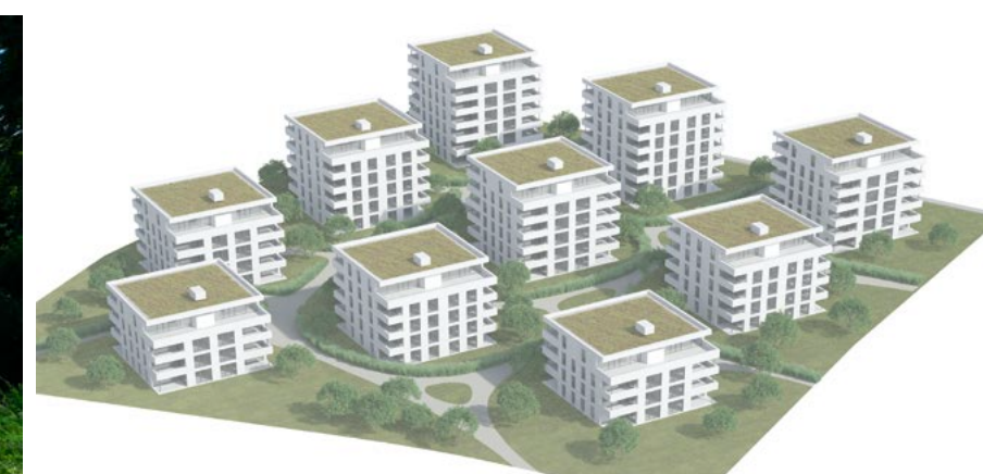
Bis 2019 entstehen am Amselweg/Lerchenweg in Zuchwil weitere rund 80 Wohnungen – mitten im Grünen